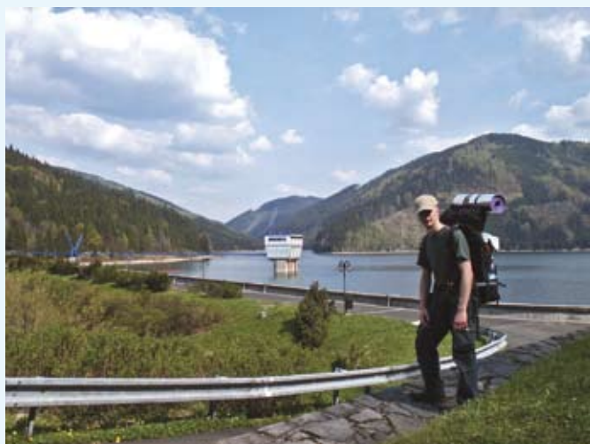
Tama Staré Hamry (w pobliżu miasta Ostravice)