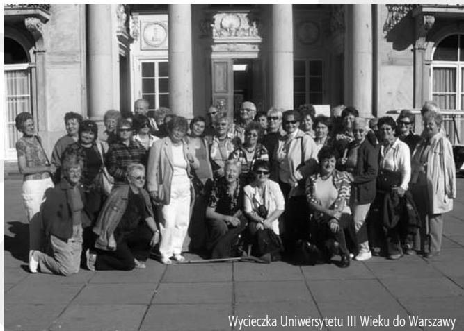
Wycieczka Uniwersytetu III Wieku do Warszawy

Cieszyński Uniwersytet III Wieku serdecznie zaprasza na Inaugurację IV roku akademickiego, która odbędzie się 12 października 2007 r. o godz. 16.00 w auli Uniwersytetu Śląskiego Oddział w Cieszynie.